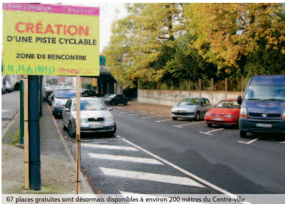
67 places gratuites sont désormais disponibles à environ 200 mètres du Centre-ville.