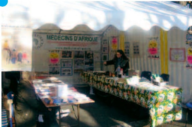
Le marché forum international sur le parvis de la mairie samedi 19 novembre.

Une semaine de rencontres en partenariat avec les associations locales.