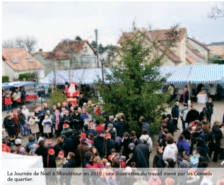
La Journée de Noël à Mondétour en 2010 : une illustration du travail mené par les Conseils de quartier.

Les conseils de quartiers s'impliquent depuis des années dans les animations et festivités orcéennes. Si Le Guichet a fait le choix, plébiscité et réussi, d'une grande brocante festive en septembre, les conseils de Mondétour et du Centre ont opté, entre autres, pour des animations toute l'année et notamment dans le cadre d'Orsay sous les sapins. Une mobilisation poursuivie cette année et tout aussi attendue !