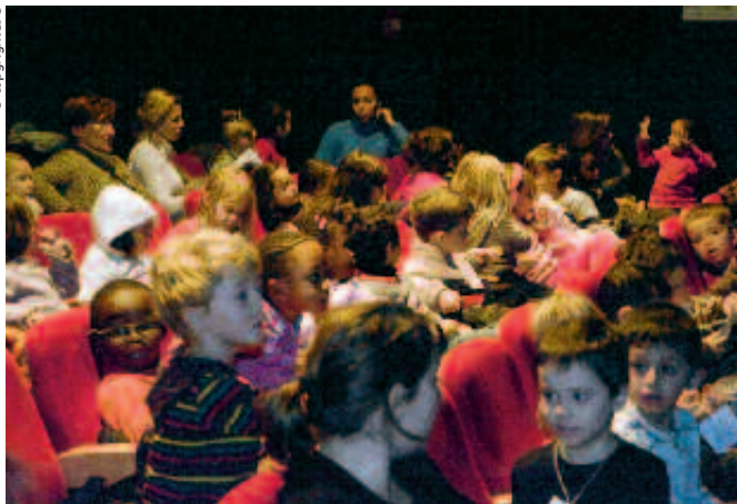
Concert jeune public «D'une île à l'autre» salle Jacques Tati.