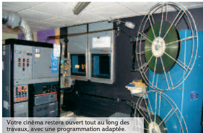
Votre cinéma restera ouvert tout au long des travaux, avec une programmation adaptée.

En contrepartie, la MJC doit maintenir la qualité culturelle qui constitue l'identité actuelle du cinéma Jacques Tati : programmer entre 65 et 70 % de films classés «Art et Essai», accompagner le public dans sa découverte cinématographique, proposer des actions