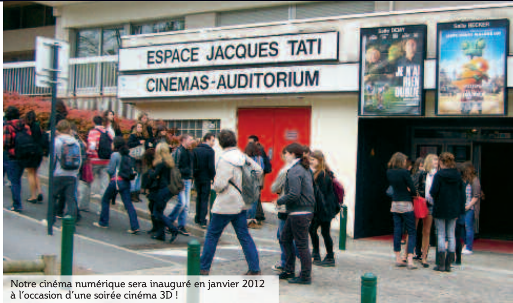
Notre cinéma numérique sera inauguré en janvier 2012 à l'occasion d'une soirée cinéma 3D !

Qualité construite autour d'une programmation exigeante, indépendante et diversifiée (court-métrages, documentaires...), de la formation et de la sensibilisation d'un public au cinéma d'auteurs par l'accompagnement des films, de l'éducation à