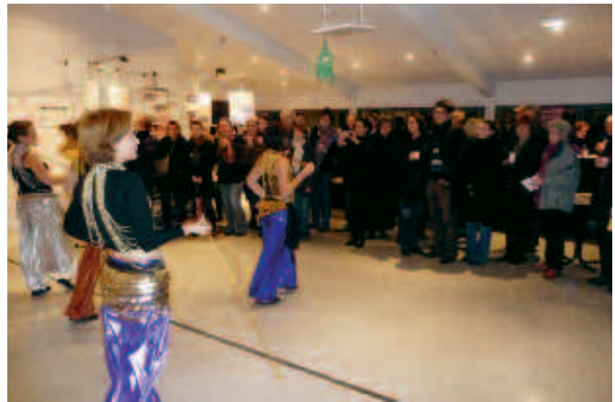
Démonstration de danse libanaise