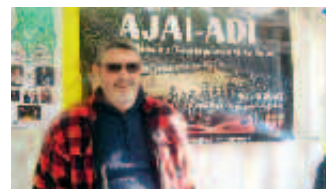
L'association AJAI ADI lors du marché-forum international, samedi 19 novembre.

Aider au développement de l'éducation des filles en Inde